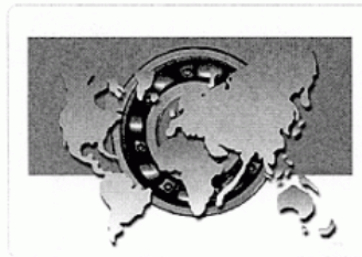
A. Gretsi kaubamärk (taotlus nr M200500859)

Mõlema tähise domineerivateks elementideks on kuul-laager ja Maa kontinentide kujutis.